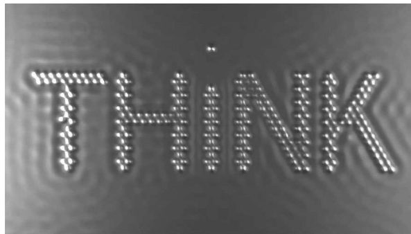
Figure 2. Think écrit avec des molécules de CO positionnées sur une plaque de cuivre. à -268,15 °C par un microscope à effet tunnel. Chaque image fait 45 x 25 nm. Extrait du film : A Boy and His Atom (IBM Research – Almaden)

La mécanique quantique entretient une certaine obscurité et un certain hermétisme. Elle a été conçue dans l'idée que ses objets resteraient définitivement inaccessibles. Or l'évolution de la technologie nous a permis d'atteindre ce qui était autrefois inimaginable. Il est maintenant possible de voir les atomes et de les manipuler avec des microscopes à effet tunnel et plus récemment, d'apercevoir l'orbitale d'atomes d'hydrogène.